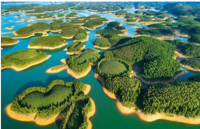
탁바(Thac Ba) 호수 관광지역

탁바 호수 관광지역은 19,000ha가 넘는 면적에 1,300개 이상의 크고 작은 섬이 있는 곳으로 여러 산 및 튀띠엔(Thuy Tien) 동굴, 쉰안롱(Xuan Long) 동굴과 같은 유명 동굴로 둘러싸여 있음. 이 지역은 ‘산 위의 하롱(Ha Long)만’에 비유되며, 대규모 생태관광지로 개발될 가능성을 갖추고 있음.