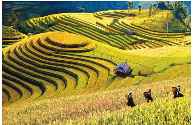
무강자이(Mu Cang Chai) 계단식 논

무강자이 계단식 논은 2,300ha에 걸쳐 펼쳐져 있는 논 지형으로 베트남 정부로부터 특별 국립 유적지로 인정받았으며, 미국 언론에 세계에서 가장 웅대하고 절묘한 아름다움을 지닌 곳으로 소개된 바도 있음. 또한 북서부에서 두 번째로 큰 논인 므엉러(Muong Lo) 논, 미네랄이 풍부한 반본(Ban Bon) 온천, 약 1,400m의 고도에 위치한 장 개울(Suoi Giang), 나하우(Na Hau) 자연 보호 구역 등은 옌바이성의 독특한 명승지임. 그 외에도 옌바이성에는 사원, 파고다, 절과 같은 많은 문화·역사 유적이 있으며 민족집단의 요리 문화 및 여러 가지의 춤, 노래 등 풍부한 무형 문화재는 국내외 관광객을 끌어들이는 요소임.